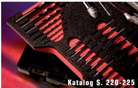
Katalog S. 220-225