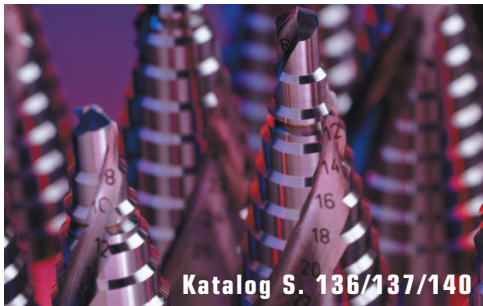
Katalog S. 136/137/140