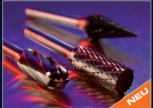
Hartmetall Frässtifte Tungsten carbide rotary burrs