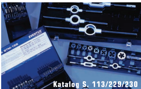
Katalog S. 113/229/230