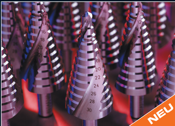
Stufenbohrer, Stufenbohrer-Bits und Fräser Step Drills, Step Drill Bits and Milling Bits