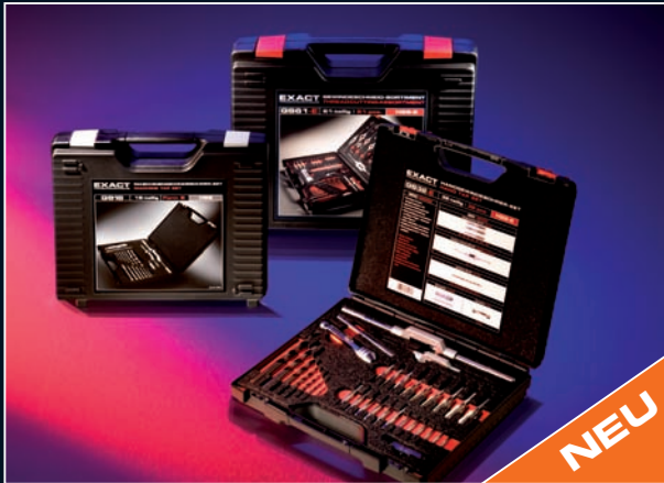
Premium Gewindeschneidsortimente Premium Thread Cutting Assortments