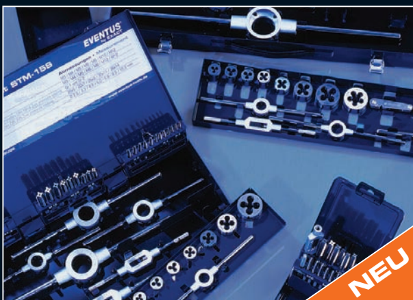
Gewindeschneidsortimente EVENTUS by EXACT Thread Cutting Assortments EVENTUS by EXACT