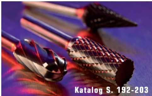
Katalog S. 192-203

The EXACT Premium Assortments for manual and machine operation stand out due to an optimized concept and innovative product design. We supply the Premium assortments in high-quality plastic and wooden toolboxes. We would like you to be convinced of the quality and the exceptional price/performance relation of our products.