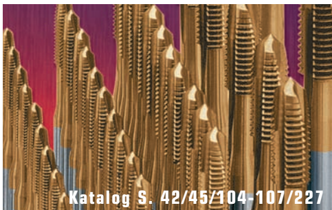
Katalog S. 42/45/104-107/227